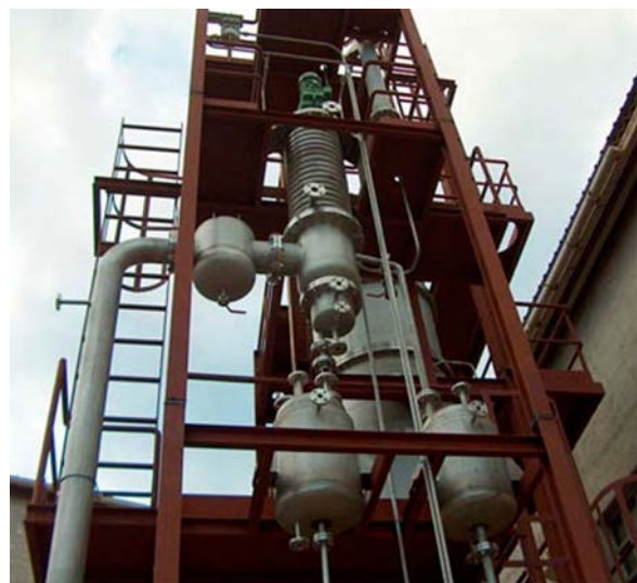
La tecnología de Zean permite la destilación a alto vacío.