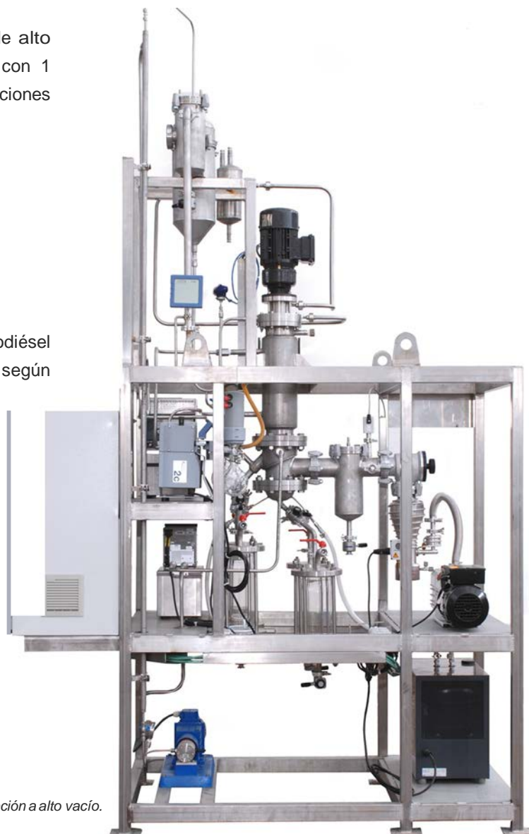
Planta piloto de destilación a alto vacío.

Todo esto permite a los productores de biodiésel cumplir las especificaciones de producto final según normativa EN14214.