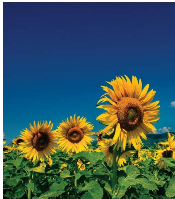
La producción de biodiésel y el resultado final está ligado a la fuente de materia prima, como el girasol.

La normativa que afecta a los biocarburantes es la EN-14214 y la que regula los parámetros fundamentales como son: el contenido de éster final en el biodiésel (> 96.5 %), así como el contenido de mono-, di- y triglicéridos, glicerina libre y total, agua, metanol, etc. Los procesos que contemplan el uso de materias primas usadas: tipo aceite de fritura, grasas animales o aceites de alta acidez tienen la desventaja de que el cumplimiento de la normativa EN-14214 se