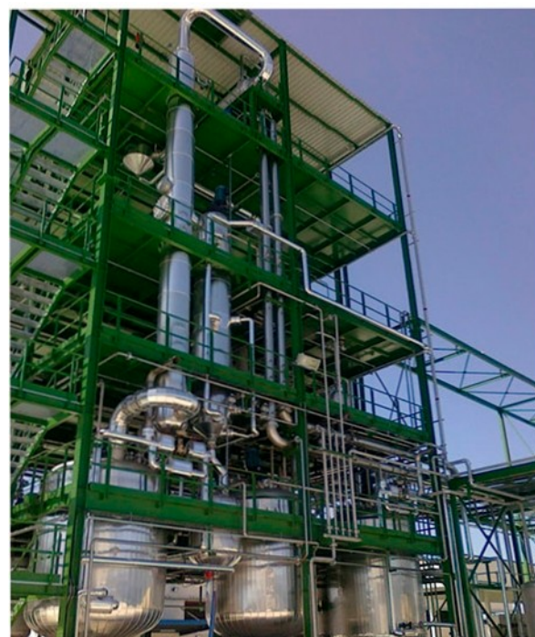
Planta para gestión y tratamiento de residuos industriales.

Permite realizar operaciones a vacío o presión atmosférica .