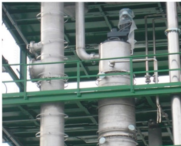
Detalle del destilador en continuo o apurador final

La instalación está equipada con un concentrador vertical de película agitada, de desarrollo propio de ZEAN , que dispone de sistema de distribución de producto en la parte superior y agitación con rascadores internos que van limpiando continuamente la pared, la operación se realiza en continuo y la capacidad de tratamiento es de 1.300-1.500 Kg/hr .